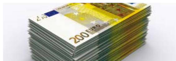
Fachartikel: Arbeitszeitaufzeichnungen im Visier des Fiskus: Strafen können empfindlich hoch sein (2014)