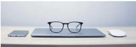
Checkliste: Gesprächsleitfaden für Zielvereinbarungsgespräche (für HR)