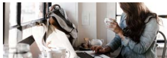
Fachartikel: Wie Sie Mehrarbeit und Überstunden rechtlich korrekt umsetzen, Teil 1 (2015)