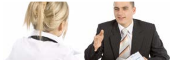
Fachartikel: Verwarnungen und diszipliniäre Schritte richtig einsetzen – ein Leitfaden für die Praxis (2014)